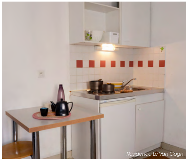
Résidence Le Van Gogh

Depuis près de 40 ans, FAC-HABITAT propose des logements réservés aux moins de 30 ans, situés à proximité des centres-villes et desservis facilement par les transports en commun.