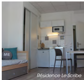
Résidence Le Scribe