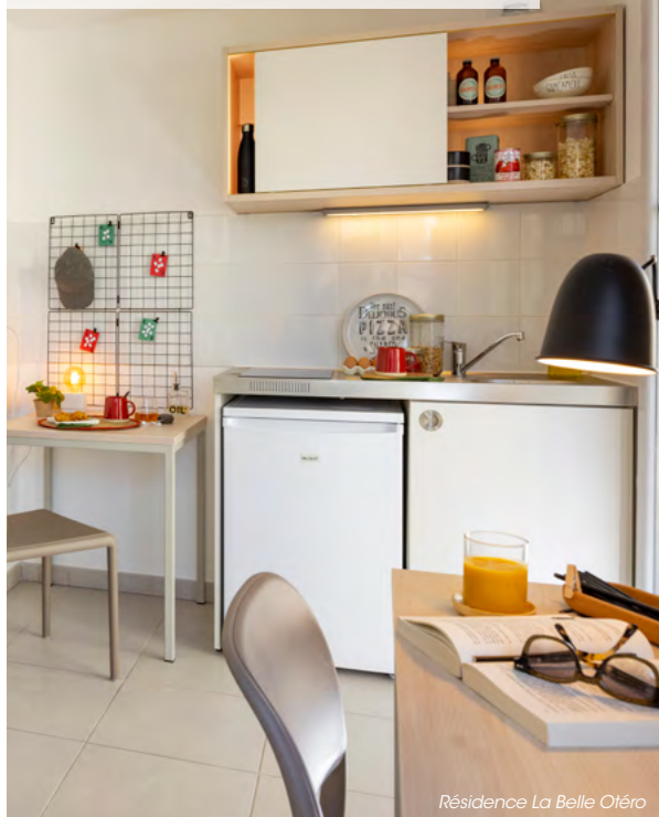
Résidence La Belle Otéro