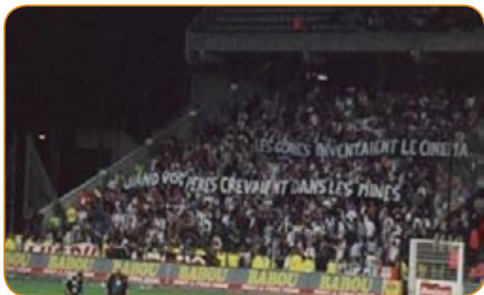
Des tribunes mal intentionnées

Une banderole insultante déployée par un groupe de supporters. Un acte vu et revu dans les travées de nos stades. Seulement cette fois-ci, un scandale est à la clef. Lumière sur l'hypocrisie des instances dirigeantes qui vont de paire avec la bêtise ambiante.