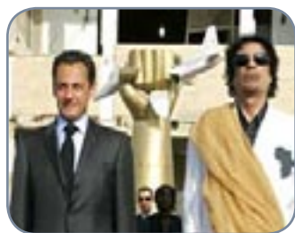
Kadhafi à l'Élysée, qui l'eut cru ?

Installé depuis plusieurs mois à l'Élysée, Nicolas Sarkozy en a oublié ses promesses électorales. Avec une vision utopique de la situation, le chef de l'État ne peut ou ne veut pas respecter ses engagements. Le slogan « du changement dans la continuité » prend à présent tout son sens, au regard des années Chirac.