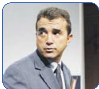
A. Lagardère Ex-actionnaire d'EADS

L'autorité des marchés financiers (AMF) a décidé de poursuivre 19 suspects pour enrichissement illégal entre mai 2005 et juin 2006. Ils sont accusés d'avoir vendu leurs actions EADS en connaissance d'informations privées sur les difficultés du groupe. Une affaire qui pourrait être lourde de conséquences pour les parties impliquées... sauf pour les deux grands patrons concernés, Arnaud Lagardère, PDG du groupe Lagardère, et Manfred Bischoff, qui dirige Daimler-Chrysler.