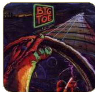
Un des albums de Big Toe

Il en a bien porté lorsqu'il avait 6 ans, mais prétendait ressembler au Capitaine Crochet. Bien que les moqueries de ses camarades fusaient dans tous les sens, le petit Mark en est ressorti plus grand. Si grand qu'une maison de disques s'intéresse de près à lui. Fini les salons de thé où les bars dans lequel le groupe Big Toe se produisait. Car Goffeney, malgré ce que l'on peut penser, a exercé de nombreux métiers avant d'accéder à la célébrité comme opérateur dans une entreprise de télémarketing. « Les autres