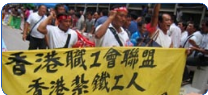
Les grèves se multiplient dans les pays du Sud

Contrairement aux idées reçues, l'implantation de multinationales en Europe de l'Est ou en Asie n'a plus pour objectif principal de produire à moindre coût, mais d'accéder à de nouveaux marchés – dans des pays dont le niveau de vie ne cesse d'augmenter. Les revendications salariales des ouvriers de Dacia en Roumanie, de Ford en Russie ou encore de Nike au Vietnam en sont une parfaite illustration.