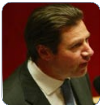
Estrosi bientôt député ?

Maire de Nice, président du conseil général et bientôt réélu député et à la tête de la CANCA. Christian Estrosi truste les mandats. À travers ce cumul local, c'est bien une stratégie nationale qui transparaît.