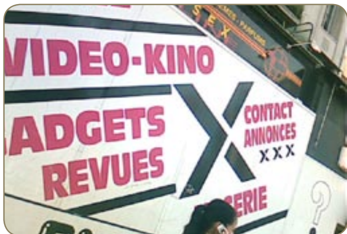
Le rendez-vous de tous mes plaisirs.

S i vous n'êtes pas majeur et averti, ne lisez pas ce qui va suivre.