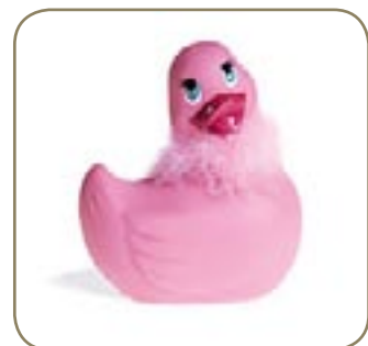
Mon mec a un bec.

Bon je dois vous laisser. Duckie m'attend dans le bain. En espérant qu'il ne s'est pas noyé entre temps.