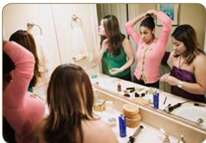
Le mystère des filles aux toilettes....

Des décennies durant, les garçons se sont posés d'innombrables questions sur les filles. Il en est une qui revient sans cesse et qui les turlupinent au plus haut point. Pourquoi les filles vont-elles aux toilettes en groupe? Grâce à des recherches minutieuses et avec l'aide des experts les plus compétents dans ce domaine, le voile est enfin levé sur ce mystère planétaire.