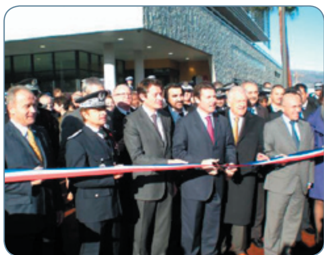
Le maire de Nice à l'inauguration du commissariat.

Christian Estrosi inaugurait vendredi matin le flambant neuf commissariat de Nice-ouest. L'édifice fait la fierté du maire de Nice et Président du Conseil général et enthousiasme les policiers qui s'y sont installés. Un premier pas dans le renouveau du quartier des Moulins.