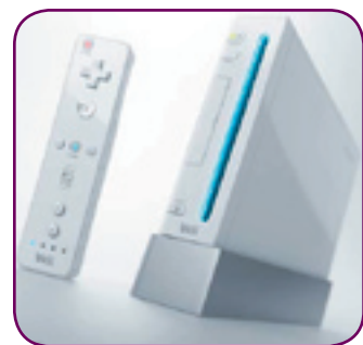
La console Wii.

Bourget, la société a décidé d'en équiper ses 89 maisons de retraite réparties dans toute la France. Installée depuis la rentrée, cette petite boîte blanche a rapidement été appréhendée par les pensionnaires. Le succès est d'autant plus important que la plupart des maisons de repos du groupe sont médicalisées et accueillent des patients à mobilité réduite. Nintendo avait pour vocation de révolutionner le monde des jeux vidéo et faire de la Wii une console intergénérationnelle. Le premier pas d'une véritable révolution a en tout cas été franchi en matière de loisirs pour les personnes âgées.