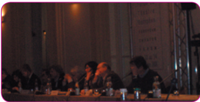
Des débats très suivis.

Du 11 au 14 décembre se tenait à Nice le forum du théâtre européen. Sous la présidence de Jorge Semprun, scénariste et ancien Ministre de la Culture d'Espagne, directeurs de théâtre, metteurs en scène, comédiens et professeurs ont débattu de l'avenir économique du théâtre.