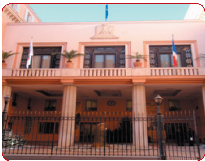
La mairie de Nice, au coeur de la polémique.

La ville de Nice, prépare son propre plan de relance. Des mesures strictes vont être adoptées pour réduire les dépenses municipales. Une diminution des effectifs de fonctionnaires crée la polémique.