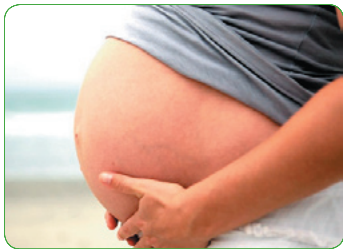
Une pratique qui a doublé en 20 ans.

Trop d'accouchements par césarienne sont injustifiés en France. La Fédération hospitalière de France (FHF) révèle, étude à l'appui, que leur nombre aurait doublé en vingt ans. Pas toujours pour des raisons strictement médicales. Les cliniques privées sont montrées du doigt.