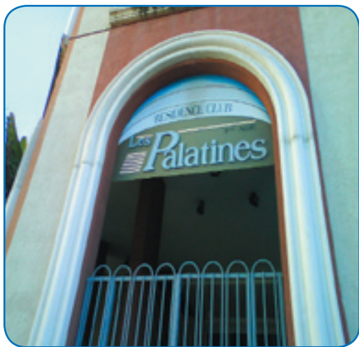
La maison de retraite les Palatines.

Depuis quelques semaines, le quotidien de certaines maisons de retraite est quelque peu bouleversé. Celle qui est devenue l'attraction de la semaine et qui éveille la curiosité des pensionnaires est en fait une console de jeux aux vertus insoupçonnées.