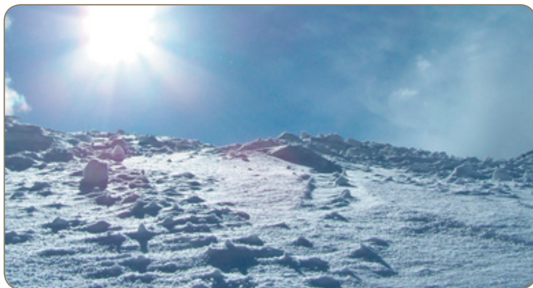
Isola 2000, toujours très enneigé.

Isola 2000 est une station qui reste parmi les plus enneigées de France. À l'approche de la décision de confier, à Nice, les JO d'hiver de 2018, le déneigement de la route d'accès et sa sécurisation par rapport aux coulées de neige, est un test de plus pour l'organisation.