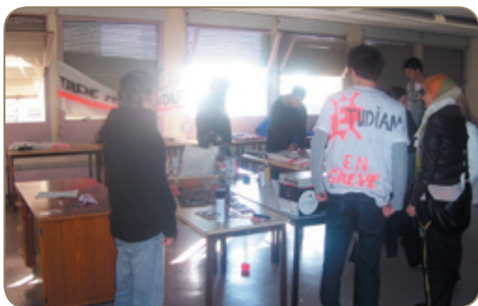
Les étudiants se préparent pour la grande manifestation prévue ce lundi.

La grève a débuté mardi dernier pour l'IUT du boulevard Napoléon III, à Nice-ouest. La loi dite de responsabilisation des universités (LRU) a été votée il y a plusieurs mois. Aujourd'hui, les étudiants, les enseignants et les directeurs d'institut universitaires de technologie craignent une baisse des subventions de l'Etat les concernant.