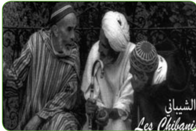
L'association est aussi un point d'ancrage pour ces bateaux ivres en mal de racines

Remplir un dossier retraite relève du vrai casse-tête pour ces hommes qui ont passé plus de la moitié de leur vie à travailler pour la France, sans pour autant comprendre les rouages de cette administration qui les dépasse. «De plus,