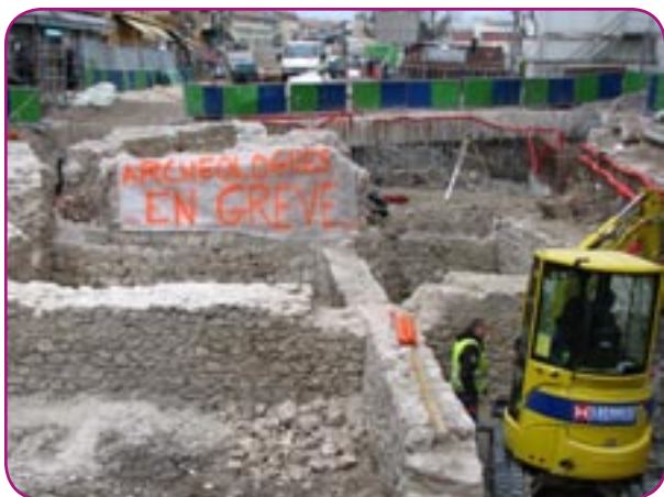
« Archéologues en grève »

P lus de pinces ni de truelles ce matin dans les vestiges de la Tour Pairolière, à quelques mètres de la place Garibaldi. Les dix-sept archéologues du site sont en grève. Les limiers de l'INRAP (institut national de recherches archéologiques préventives) ont déposé leurs outils de travail pour afficher leur mécontentement. «Votre patrimoine est en danger», peut-on lire sur les banderoles accrochées autour des fouilles. Leurs revendications sont simples : « nous souhaitons la reconduction des contrats jusqu'à la fin du chantier, prévue pour la fin octobre ». Pourtant, leurs CDD (contrats à durée déterminée) se terminent le 31 mars. Et même le 28 février pour deux d'entre eux. C'est