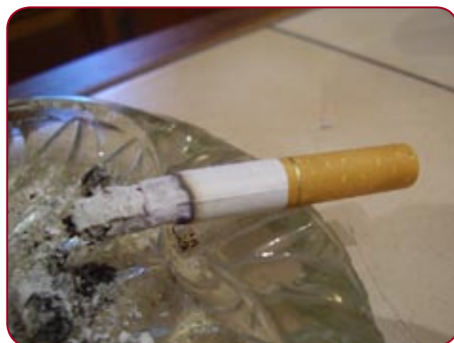
Le plaisir de fumer dans les lieux publics

Direction la gare. Là, il y a plus de passage: une bonne âme procédurière me fera bien la remarque. Un train vient d'arriver, la foule se déverse dans le hall. C'est le moment ou jamais. La petite flamme approche de la cigarette. Un peu de fumée s'en échappe. C'est bon... mais ça dure pas longtemps. La sécurité veille: «Non non monsieur, c'est interdit de fumer ici». «Ah bon? Et je risque quoi si je continue?». «Soixante-huit euros d'amende, ça fait cher la clope». Ouais c'est sûr. «Mais vous, vous êtes pas habilité à me mettre une amende».