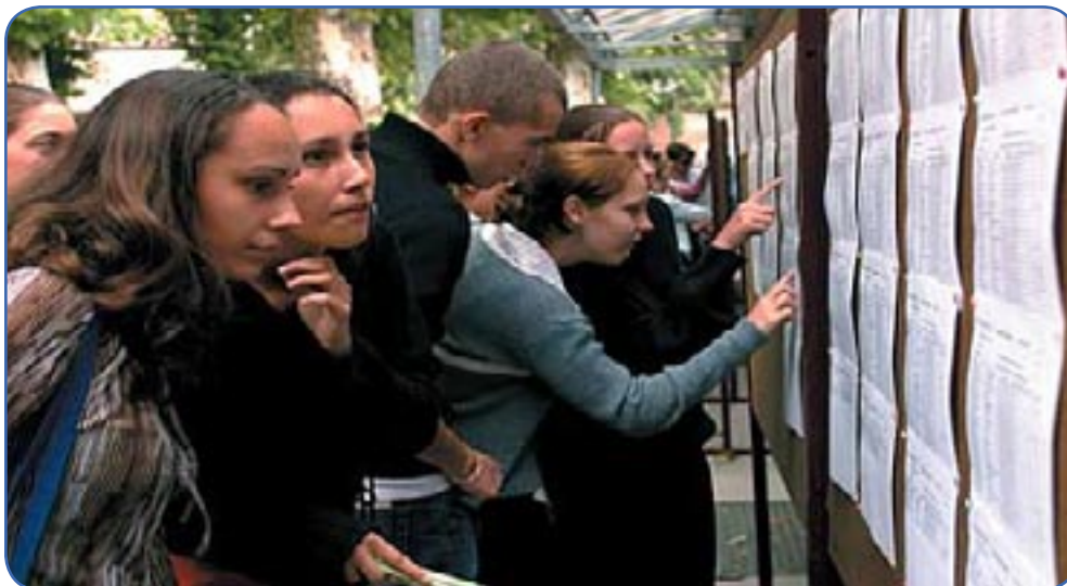
Le Bac Blanc, un bon test pour mesurer ses compétences

N 'en déplaise à certains, le fameux bac blanc a bien eu lieu au lycée Guillaume Apollinaire de Nice.