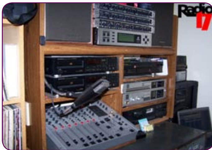
Un studio radio