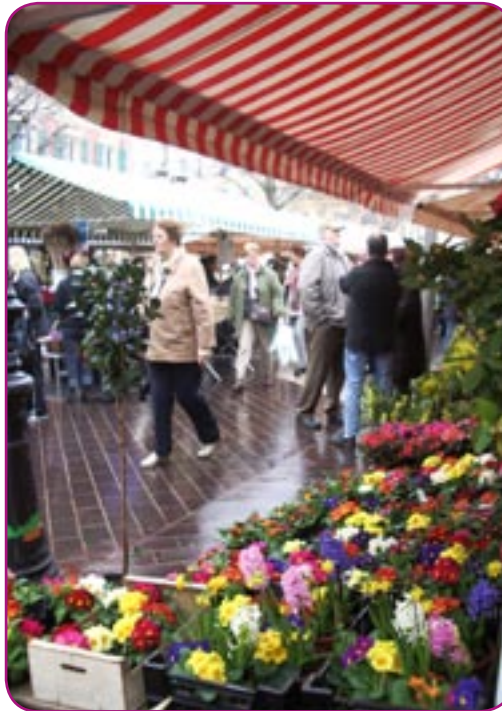
A Nice, les touristes affluent toute l'année

Une vingtaine de camping-caristes ont élu domicile au Camping Saint Michel de Menton. Et l'accueil n'a pas été très agréable. C'est le moins que l'on puisse dire. «On ne veut pas de nous dans cette région. Faut croire qu'ils n'aiment pas les euros qui sortent de nos poches». La