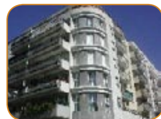
Une résidence gérée par Gestrim Campus.

Pour tout problème de logement, contacter l'ADIL au 04 93 98 77 57. Les juristes reçoivent gratuitement sur rendez-vous.