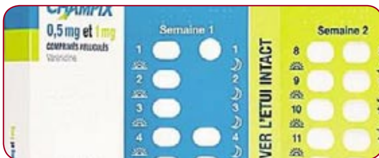
Le champix, nouveau remède pour arrêter de fumer.

Le laboratoire américain Pfizer commercialise depuis une semaine un nouveau médicament pour aider au sevrage tabagique. Baptisée Champix, la pillule anti-tabac agit directement sur les récepteurs nicotiques de votre cerveau grâce à l'action d'une molécule: la Varénicline.