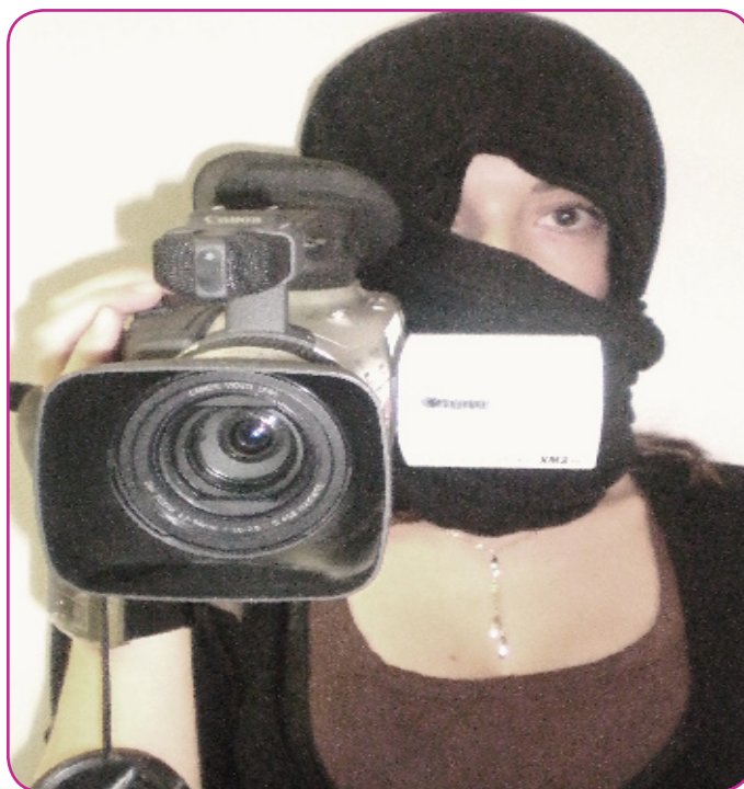
Espionnage ou journalisme ?