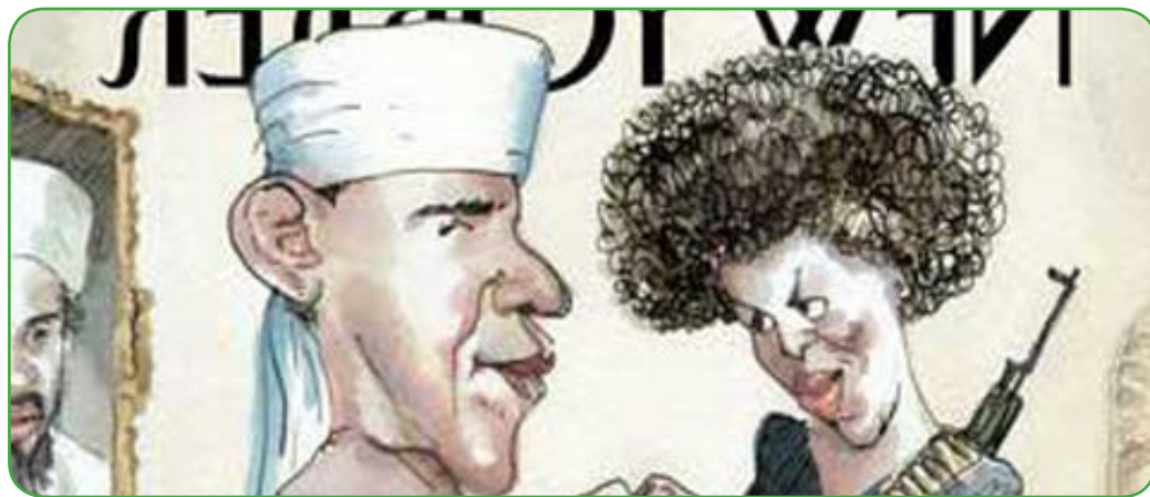
Couverture du New Yorker montrant Barack Obama habillé en islamiste intégriste.

À douze jours des élections présidentielles, Barack Obama caracole en tête des sondages, devant John McCain. La tendance actuelle laisserait présager une victoire indiscutable, mais un élément décisif, camouflé et nié, germe dans cette élection : la couleur de peau du candidat démocrate.