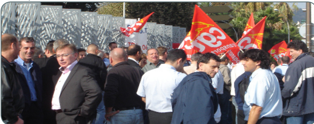
Une centaine de chauffeurs se sont réunis jeudi devant l'Acropolis pour appeler à une convention commune.

Des perturbations ont pu être observées jeudi aux approches de la ville de Nice. L'appel à la manifestation de la CGT a été suivi par celui des contrôleurs de trains.