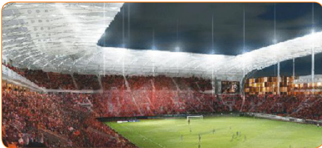
Projet de grand stade en 2006... finalement avorté quelques mois plus tard.

Après deux précédents projets avortés, la grande enceinte sportive attendue par la cinquième ville de France verra le jour en 2013. Avec une capacité de 35 à 40 000 places, Nice souhaite enfin évoluer dans la cour des grands.