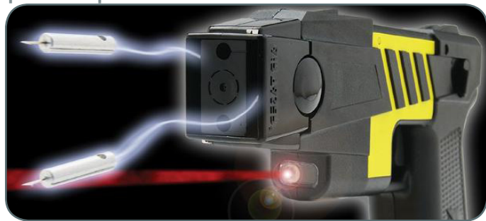
Les Taser français seront équipés d'une caméra.

Adopté dans près de 65 pays, le Taser X26 est la nouvelle arme en vogue. Censé sauver des vies en évitant le recours à l'arme à feu, son utilisation fait pourtant polémique.