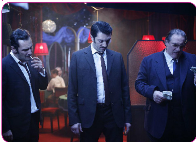
Trois hommes et un coup fin.

Il aura fallu presque 30 ans pour que Jacques Mesrine crève de nouveau l'écran. Sous les traits d'un Vincent Cassel époustouflant, l'ennemi public numéro 1 sort d'un cercueil trop petit pour lui. Il fallait un grand film (même deux) pour un type pareil.