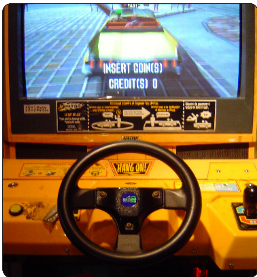
Des dizaines de personnes, chaque jour, se ruinent un peu plus dans les «vidéos games»