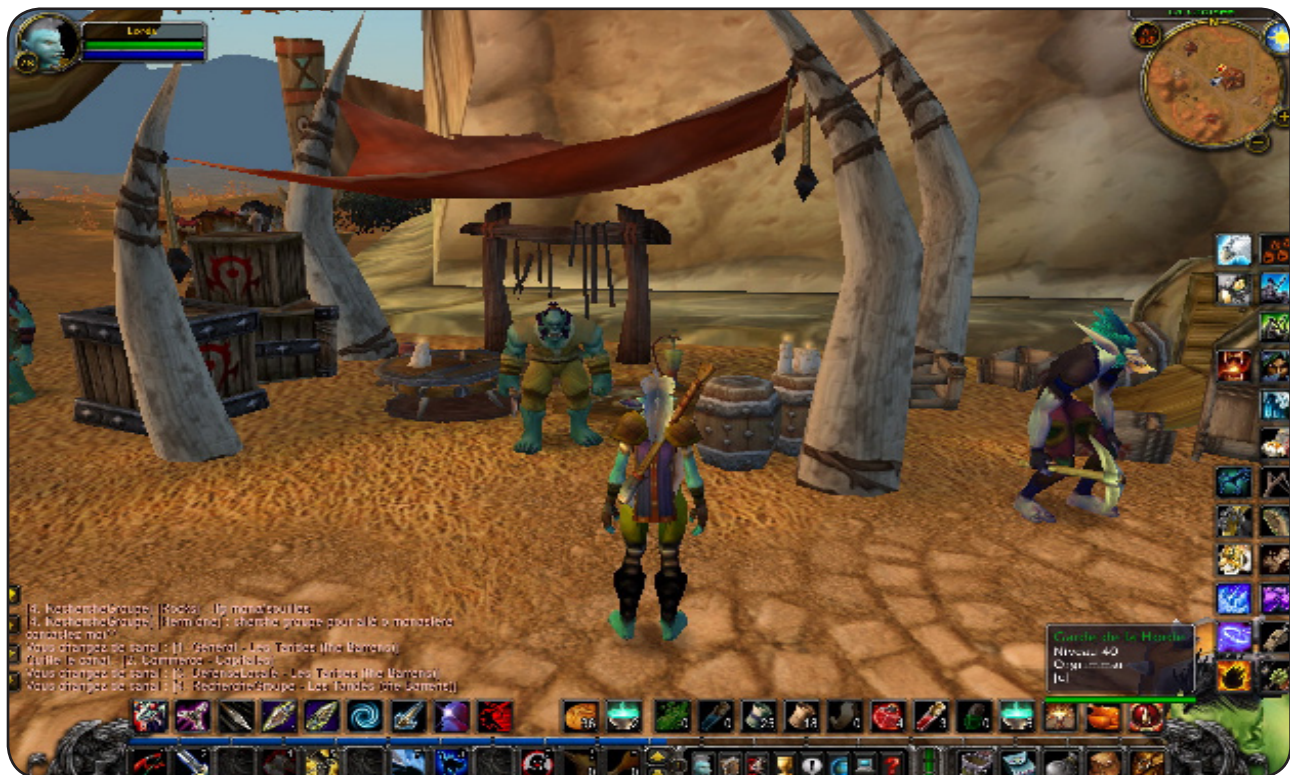
Warcraft : un monde où se cotoient elfes et autres créatures extraordinaires

Sorti il y a sept ans, World of Warcraft, plus connu sous l'acronyme WoW, est un véritable phénomène mondial. Le plus représentatif des MMORPG- Massive Multiplayer Online Role Playing Game-, autrement dit, les jeux de rôle en ligne multijoueur. En France, ils sont un million à jouer aux MMORPG et cinq