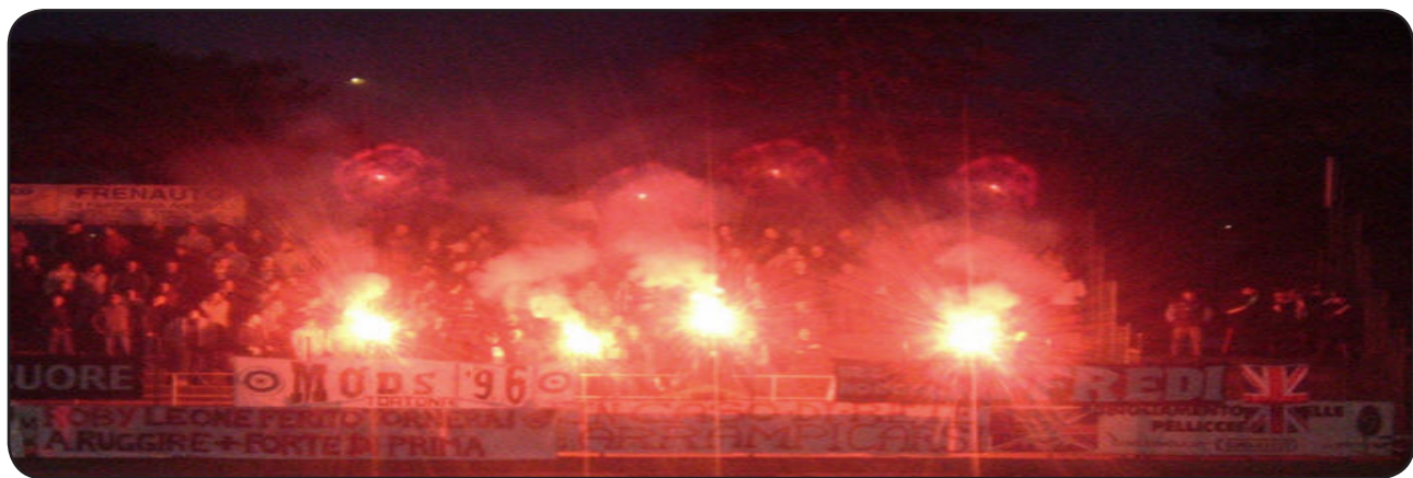
Supporters ultras agitant des fumigènes

Ils s'appellent «Commando ultra», «Boulogne Boys» ou «Brigade Sud Nissa» et se livrent une guerre sans merci. En marge des matchs de football, les supporters les plus radicaux planifient leurs affrontements grâce à Internet.