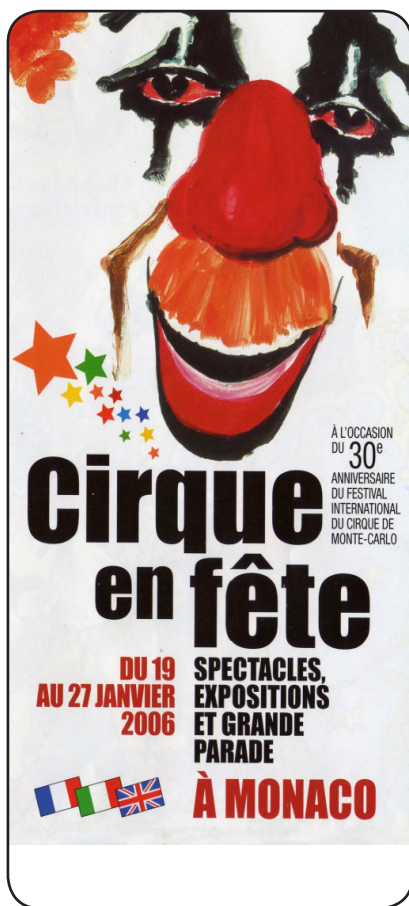
L'affiche du cirque de la Principauté