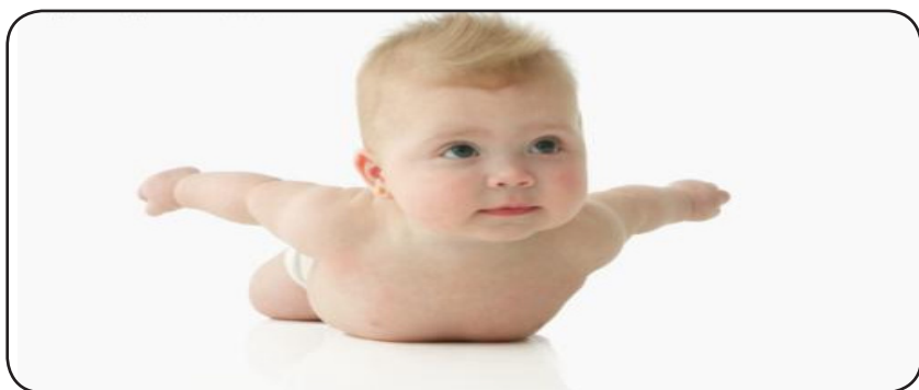
Bébé semble s'en donner à coeur joie

Roulades effrénées sur tatamis moelleux, courses folles après ba-balles rebondissantes : dans une France féconde, les activités pour bébés se multiplient. Papa et maman peuvent aussi participer. Un pur moment de plaisir.