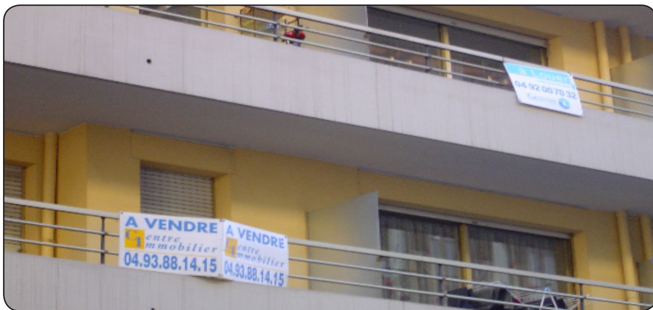
De plus en plus d'appartement sont en vente à Nice.

Anglais, Italiens, Irlandais, Néerlandais et même les Russes se jettent sur la moindre maisonnette azurienne. De quoi contribuer à la hausse des prix de l'immobilier à Nice.