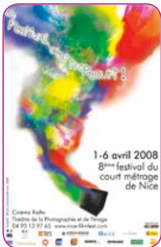
Le court métrage arrive à Nice

Du 1 er au 6 avril 2008, le cinéma Rialto et le Théâtre de la Photographie et de l'Image accueillent la huitième édition du festival du court métrage de Nice. Une occasion pour les cinéphiles de découvrir une autre forme de cinéma.