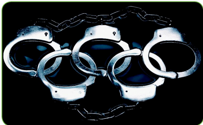
Les Jeux olympiques sont pris en otage par les enjeux géopolitiques

Après les récents événements au Tibet, des doutes s'élèvent contre le bon sens d'organiser des Jeux Olympiques dans un pays, la Chine, qui semble loin de partager les valeurs que véhicule la grande messe du sport internationale.