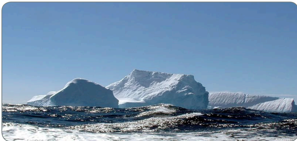
La banquise se réduit comme peau de chagrin

La banquise s'effrite chaque jour un peu plus. La menace d'un réchauffement planétaire se précise. Les températures augmentent dangereusement, laissant présager une France au climat tropical dans quelques siècles.