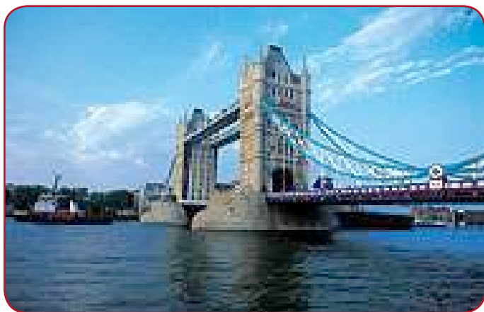
Le Tower Bridge, monument « so british »