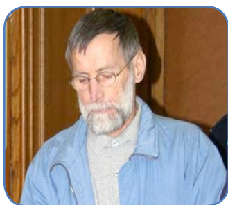
L'ogre des Ardennes

Le procès de Michel Fourniret et de sa femme Monique Olivier s'est ouvert le 27 mars à Charleville-Mézières. Accusé de sept meurtres, le monstre des Ardennes pourrait bien se voir voler la vedette par sa compagne dont la personnalité reste obscure.