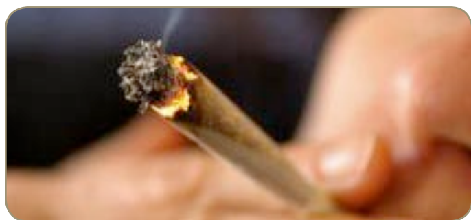
Le joint n'effraie plus

Il semble bien loin le temps où les jeunes allaient se griller une clope à la sortie du lycée. Si la première cigarette a toujours un petit goût d'interdit, aujourd'hui elle ne fait plus rêver. La consommation quotidienne chez les adolescents et les jeunes adultes révèle que 33% des moins de 17 ans fumaient en 2005 contre 41% en 2000. Aujourd'hui, la cigarette est ringarde, elle a laissé place aux drogues dures. Champignons hallucinogènes, ecstasys, amphétamines, cannabis et cocaïne sont les nouveaux paradis artificiels de la jeunesse.