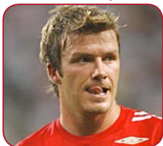
Beckham est de retour

Le Stade de France accueillait, mercredi 26 mars, la trente-septième rencontre entre la France et l'Angleterre. Cent ans déjà que les deux équipes se livrent une farouche bataille, des premières victoires britanniques aux derniers exploits tricolores.