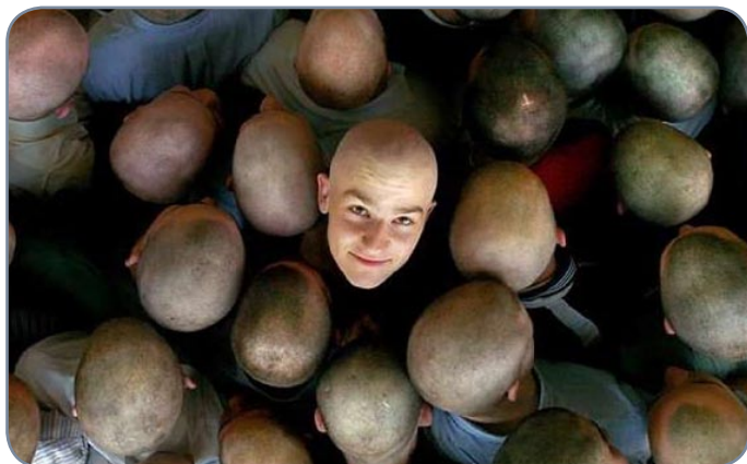
La calvitie ne cesse de diviser.

La perte de cheveux est, depuis quelques années, devenue l'une des préoccupations principales des Français. Véritable angoisse pour certains, légère gêne chez d'autres, la calvitie ne cesse de diviser. Si les personnes âgées ont bien du mal à y réchapper, il semblerait qu'elle prenne aujourd'hui les devants sur la jeunesse.