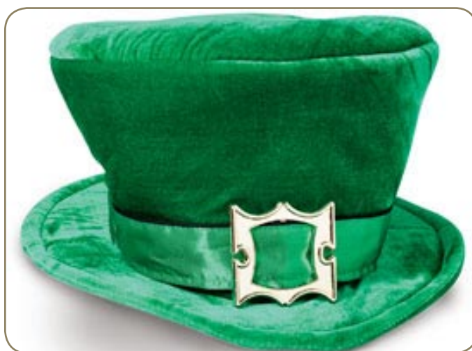
La fête irlandaise s'exporte bien.

Le cœur du Vieux Nice sera rythmé au battement des percussions celtiques et autres performances musicales, ce week-end. Ainsi, le De Klomp, situé rue Macoinat et le Daddy's Pub, dans la rue Droite, ont prévu des concerts, des soirées celtiques, des animations... Tout est mis en œuvre pour rendre hommage au missionnaire qui convertit l'Irlande au christianisme. Mais il n'y a pas que de l'alcool dans la fête. Il y a du vert aussi.