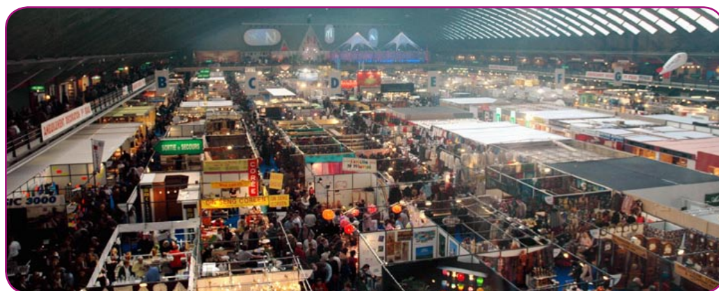
Le Palais des expositions accueille la Foire de Nice jusqu'au 17 mars 2008.

Nous sommes encore en hiver. C'est certainement pour cette raison que, comme chaque année, la foule vient s'entasser au chaud, à travers les centaines de cages à poules de la Foire de Nice. Du 8 au 17 mars, des camelots plus zélés les uns que les autres s'en donnent à cœur joie pour rivaliser d'ingéniosité... ou de fourberie.