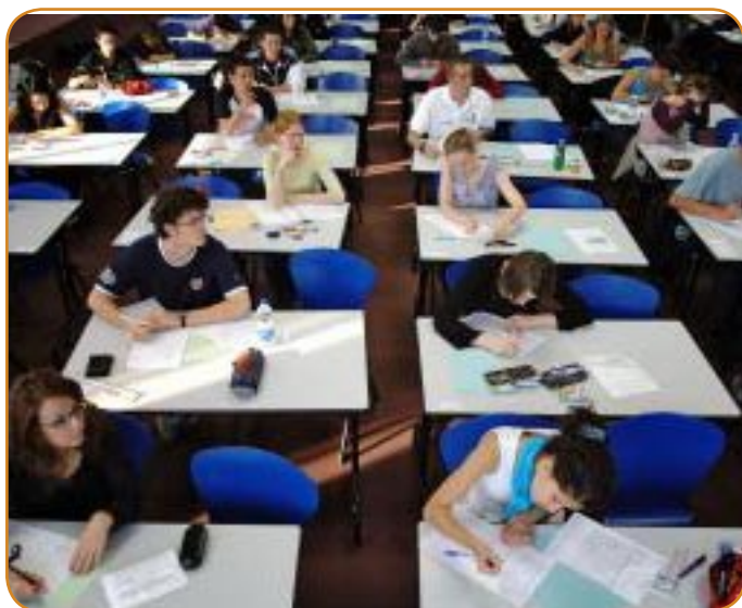
Le Bac : une affaire de hasard.