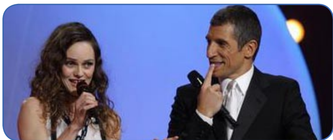
Vanessa Paradis, grande gagnante.

Pour tous ceux qui osent encore regarder les Victoires de la Musique, que se soit par perversité ou simplement par pure curiosité, l'édition 2008 aura été mitigée. Les amateurs de ridicule et détracteurs de la musique française auront été les plus rassasiés par le spectacle.