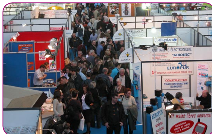
La foule se presse autour des stands.

Le Souk de Marrakech peut pâlir. La Foire de Nice, c'est l'occasion de dénicher des billards en peau de zèbre. Des fers à repasser qui cuisent également les légumes grâce à la vapeur. Des grains de riz avec votre prénom dessus. Des coussins masseurs. Des tables à repasser sans l'aide de fer. On vous cire même les chaussures, au propre comme au figuré.