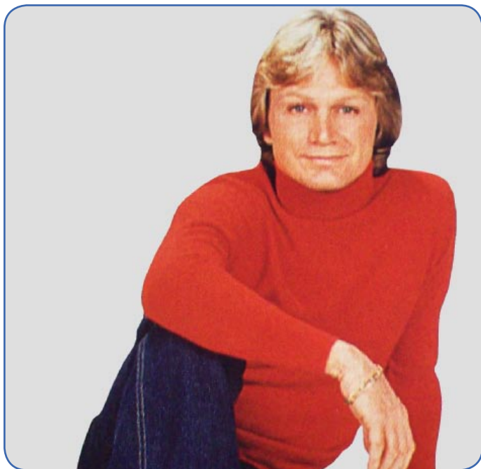
Le caractère tyrannique de la star a souvent fait la Une.

30 ans le 11 mars que les fans se sont mis à pleurer dans toute la France en apprenant la nouvelle : Cloclo est mort, électrocuté dans sa salle de bains. 30 ans que cet anniversaire est célébré religieusement et que les mêmes bouquins et CD ressortent avec juste, parfois, une couverture différente.