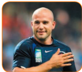
Michalak le sex-symbol

Les femmes rêvent d'eux. Eux hantent tous leurs fantasmes. Leur force : ils sont pompiers, militaires voire rugbymen. A Nice, aucune ne sait résister à leur uniforme. Restent les autres. Chauffeurs de bus, libraires ou cordonniers, tous se révoltent contre l'instinct sélectif de la gente féminine.