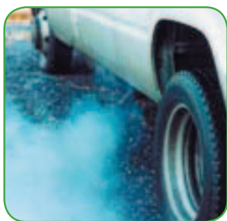
Grenelle: une voie d'échappement politique ?

Les 24 et 25 octobre, se déroulent à Paris les tables rondes finales du Grenelle de l'environnement. Comme en 1968 avec les accords sur les salaires, le gouvernement veut frapper un grand coup. Mais quelle réalité se cache derrière cette volonté farouche ? Marketing politique ou réelle prise de conscience ?