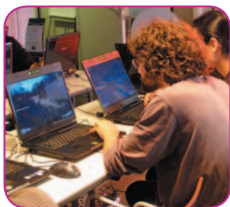
Un geek parmi tant d'autres

Initialement «fou» en anglais, le geek est un passionné d'informatique. Et par passionné, il faut comprendre «accro». Tentative d'approche du phénomène