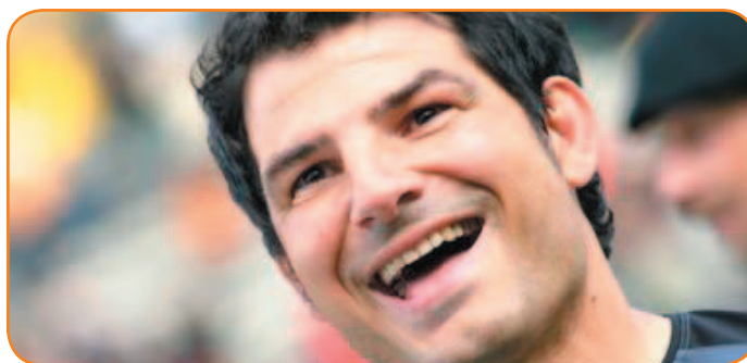
Marc Lièvremont, nommé à la tête du XV de France.

Quoi qu'il en soit, l'avenir de l'équipe de France repose dans les mains plus ou moins novices de ces deux entraîneurs. Pourquoi donner les rênes du XV de France à deux hommes non-initiés au très haut niveau ? La version officielle voudrait que Jean-