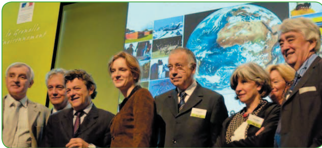
Jean-Louis Borloo est le maître de cérémonie.

Mobilisation sans précédent en France pour l'environnement, cette consultation souhaitée par Nicolas Sarkozy est saluée par tous. La marche écolo est en route.