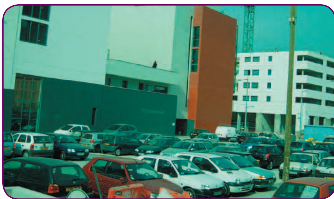
Le parking de la fac subit la rénovation du quartier.

Colère à la fac de Saint-Jean d'Angély. Les étudiants ne pourront plus garer leur voiture sans payer un abonnement pour une place de parking jusqu'à présent gratuite.