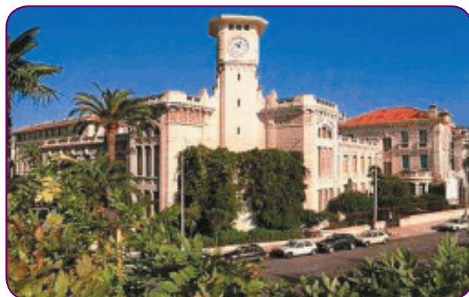
Cérémonie du souvenir au Lycée Masséna.