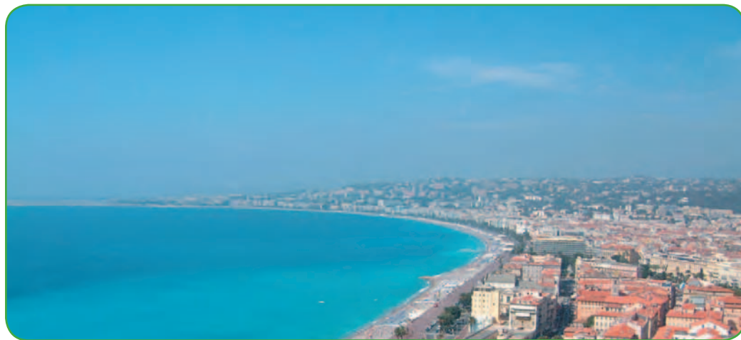
D'Antibes à Cap d'Ail, 10 communes du littoral ont pris des mesures en faveur de la préservation de l'environnement.

En matière d'environnement, la Communauté d'Agglomération Nice Côte d'Azur s'est déjà engagée par l'intermédiaire d'une charte et du contrat Baie avec les communes du littoral d'Antibes à Cap d'Ail.