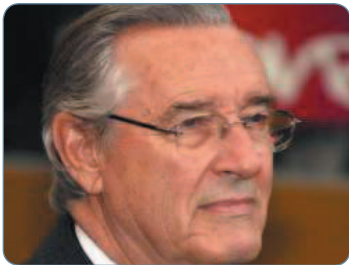
Pour Jacques Peyrat, l'heure du choix a sonné.

A moins de 6 mois des élections municipales, le maire de Nice est dans une position bien inconfortable. Dépouvé de tous ses soutiens, sans investiture, Jacques Peyrat a le choix entre une curieuse alliance avec le FN, où il a fait ses premières classes politiques, et un abandon pur et simple de sa candidature. Alors : ira, ira pas ?