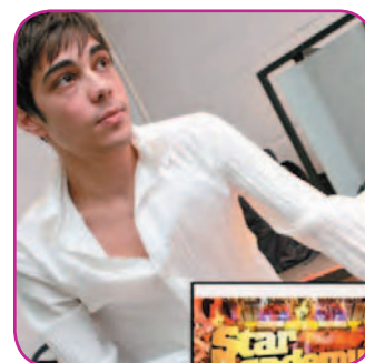
Les élèves rendront hommage à Grégory Lemarchal

lever matin ? Zappez le jour de la finale, vous n'aurez assurément rien perdu.