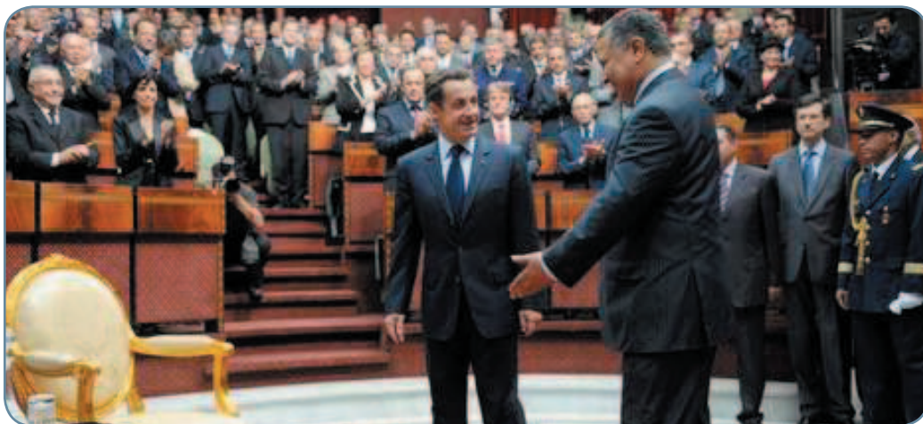
Nicolas Sarkozy fait forte impression au Maroc.

Pour sa première visite au Maroc, en tant que Président de la République, Nicolas Sarkozy a mobilisé l'élite de la politique marocaine, avec sa volonté de concrétiser le projet d'Union Méditerranéenne.