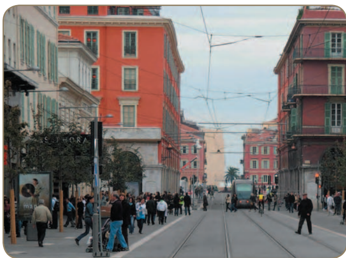
Les piétons ont enfin regagné le trottoir.

A un mois de l'inauguration du tramway, les Niçois sont enfin rentrés dans le rang. Les campagnes de prévention ont trouvé des oreilles attentives. Désormais, la grande majorité des piétons a retrouvé le chemin des trottoirs et les automobilistes ne gênent quasiment plus les essais.