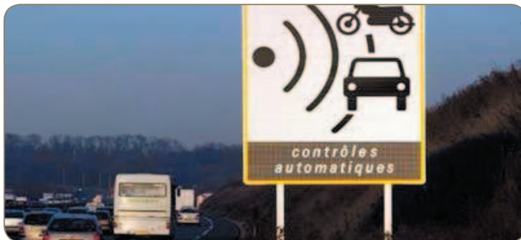
Les radars trichent, pas toujours en notre faveur.

Des milliers de personnes sont concernées par cette fracassante révélation : les radars ne sont pas fiables. Explications et astuces pour éviter de se faire flasher.