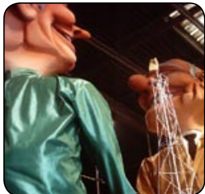
Jacques Chirac et Tony Blair au carnaval !