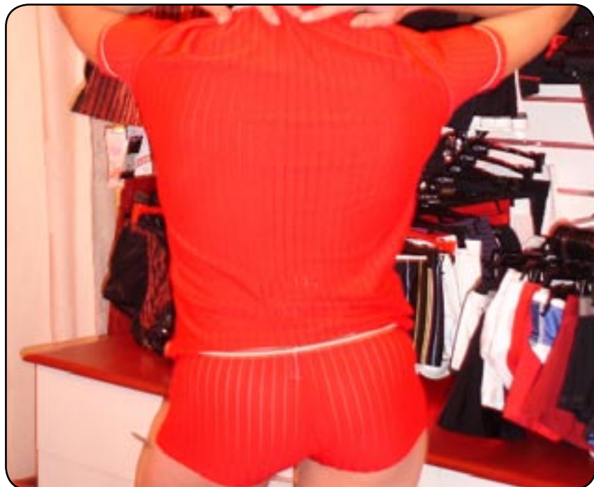
Moderne et branché, l'homme ose

Lorsqu'on leur pose la question «Etes-vous slip ou caleçon ? », la majorité des mecs répondent : «caleçon». Eh bien messieurs, désolée de vous décevoir mais rangez au fin fond de votre tiroir vos caleçons préférés. Fini les marcel, slips kangourous ou caleçons larges qui cachent vos formes. L'homme d'aujourd'hui se veut branché et à la mode, jusque dans ses secrets dessous. Boxeur taille basse, shorty moulant, string, sont les grandes vedettes en matière de lingerie masculine.