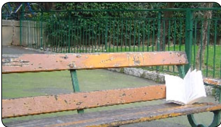
Un livre oublié sur un banc

Vous aimez lire, partager votre passion et un peu d'aventure vous tente bien, alors le book crossing est fait pour vous. A Nice, le concept fait de plus en plus d'adeptes.