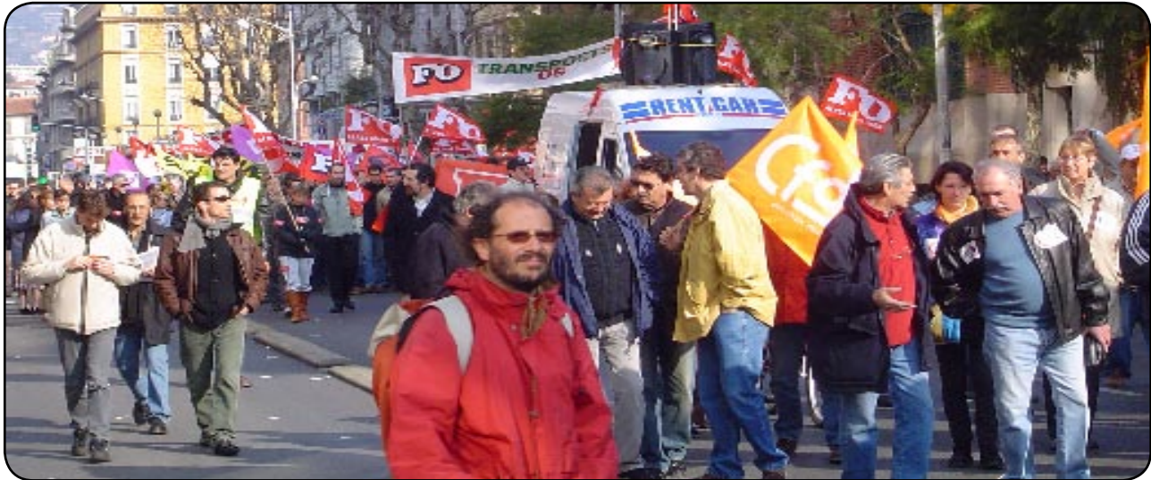
Manifestation dans les rues de Nice, les syndicats étudiants de gauche en tête

Le Premier Ministre, Dominique de Villepin, avance son Contrat Premier Embauche (CPE) comme une opportunité de relancer le marché du travail en France. De leur côté, les syndicats étudiants de gauche motivent les troupes en vue des grandes manifestations et dénoncent la précarité du CPE.