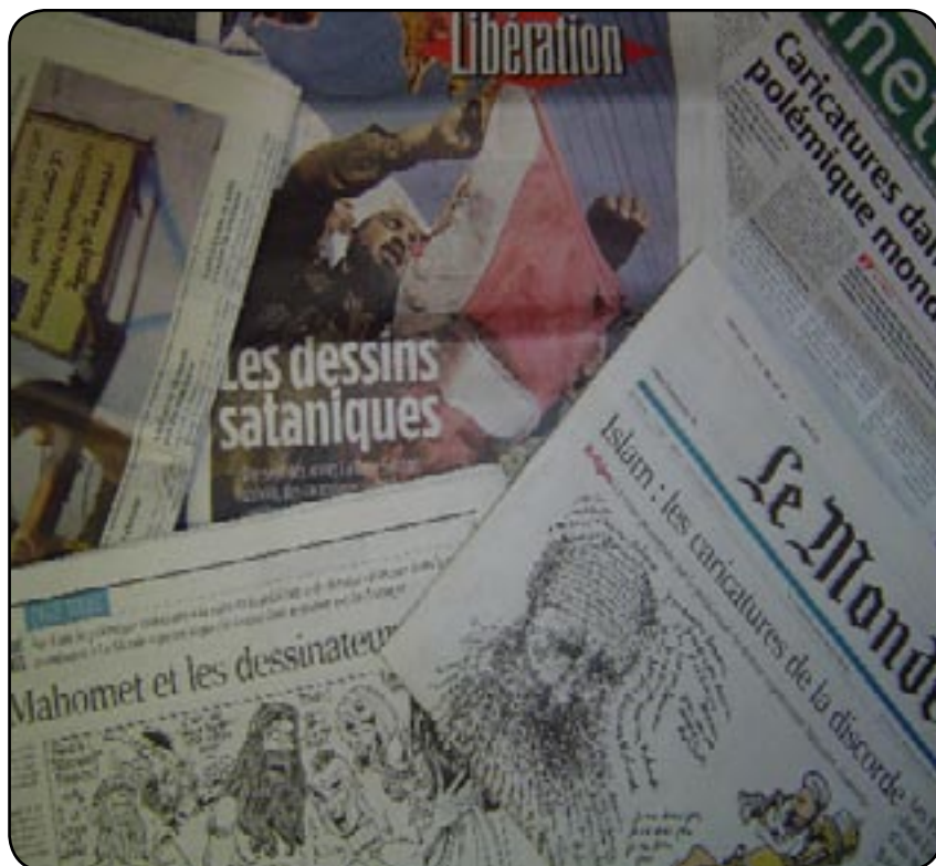
Caricatures danoises, la presse se déchaîne

U ne fois n'est pas coutume, cette semaine, votre magazine Curieux.net commence par un billet d'humeur. Face à une actualité un peu particulière, nous nous devons de prendre la parole de façon particulière. Avant d'aller plus loin dans ces lignes, je tiens à signaler que ce billet, n'engage que son auteur. Après avoir discuté avec quelques rédacteurs, je me suis vite rendu compte que nous n'avions pas tous le même point de vue. Même si nous partageons quelques avis communs, il valait mieux se montrer prudent avant d'engager une quelconque opinion commune, et qui finalement n'en sera pas une. Il est important de parler de la liberté de la presse, de la liberté d'expression et de ses limites, de l'intolérance de certains et de la poussée de l'islamophobie qui touche un peu plus, tous les jours, la France.