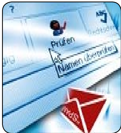
Les emails payants bientôt dans votre messagerie électronique

AOL et Yahoo s'attaquent à la sacro-sainte gratuité de l'email. Les deux géants d'internet vont facturer aux entreprises des courriels prioritaires. Début d'une révolution !