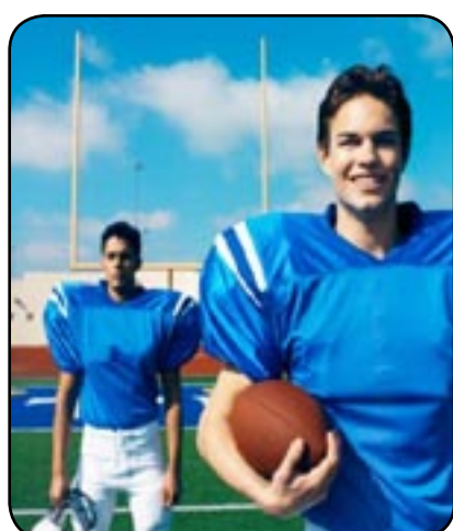
Le football américain, un sport méconnu en France

C'était dans la nuit de dimanche à lundi et c'était une première en France. La diffusion du superbowl en direct et en intégralité sur une chaîne du service public. Une très belle vitrine pour le football US, trop méconnu en France.