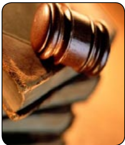
Condamner sans procès

TF1, France 2, Europe 1, les plus grands médias se mobilisent pour couvrir l'audition du juge Burgaud. Le désir d'explications des acquittés se mêle aujourd'hui à une surenchère médiatique sans précédent, au détriment de Fabrice Burgaud.