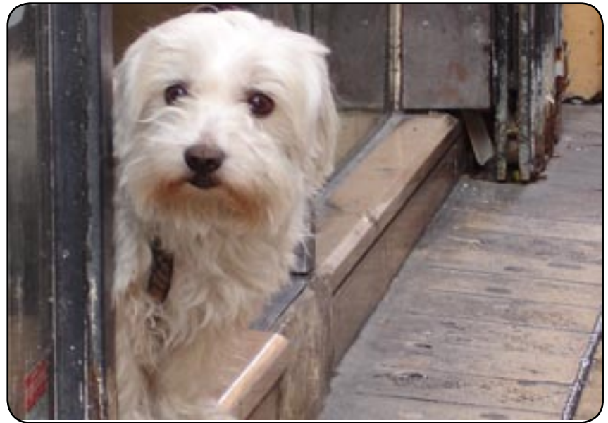
Certains chiens souffrent d'anxiété de séparation lorsque leur maître s'absente... Une solitude qui les rend tout malheureux.