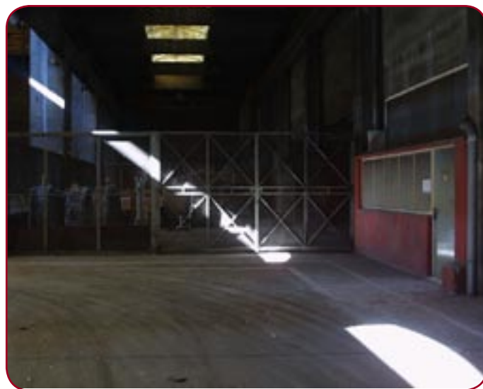
L'ancien hangar deviendra un lieu de culture incontournable

Ils rient jaune ces intermittents du spectacle, lorsque la mairie dit vouloir faire de l'ancienne entreprise, une friche culturelle. « Ce type de projet fonctionne grâce à un financement européen. La réha-