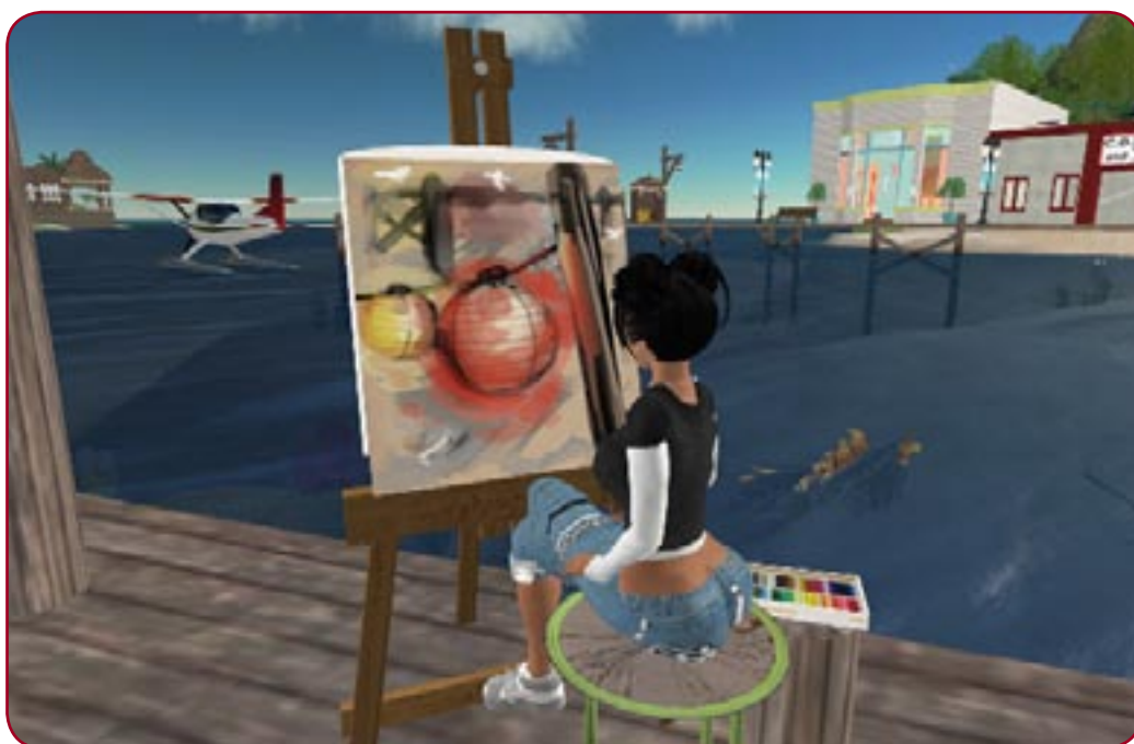
Peindre ou faire l'amour? Telle est la question.

« Enfin, pour terminer ce journal, un attentat à l'arme automatique a eu lieu hier... dans Second Life ». Sortie de son contexte, cette phrase peut faire sourire. Malheureusement, elle prend toute sa signification lorsque l'on s'aperçoit qu'elle est tirée du journal télévisé d'une grande chaîne nationale. Trois ans après son apparition dans le cyberspace, Second Life continue d'obséder les médias. Ces derniers ne sont d'ailleurs pas seuls sur le coup : les politiques et les grandes marques sont également de la partie. Et si cette « seconde vie » peut sembler, par certains aspects, n'être qu'un jouet informatique, ses aspirations sont assurément bien plus grandes.