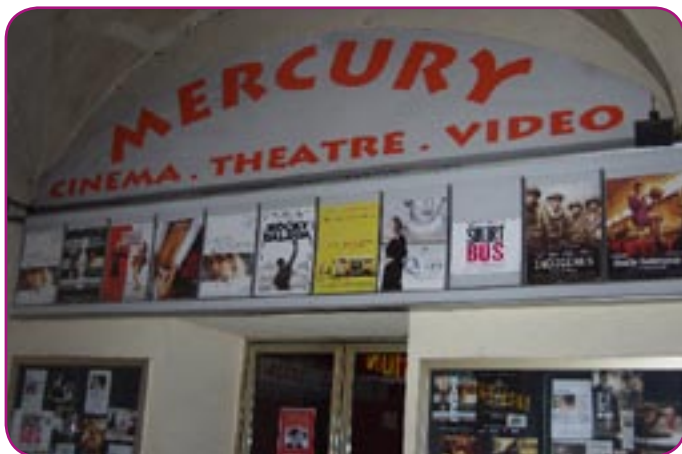
Le Mercury, 16, Place Garibaldi, 06 300 Nice

S ous les arcades de la place Garibaldi, un touriste anglais s'inquiète : « Can we see original version in this cinema ? » demande-t-il. Le voilà rassuré, ce week-end, il pourra voir « The Queen », que tout bon anglais qui se respecte se doit de l'avoir vu, dans sa langue maternelle. Le cinéma Mercury, datant de 1972, situé Place Garibaldi, est racheté par le Conseil Général. Cette transaction, annoncée lundi, empêche ainsi la disparition d'un des patrimoines de la ville. Ce cinéma d'art et essai propose des salles intimistes et une programmation toujours plus variée. Il comprend une grande salle de 84 places et trois plus petites. Malgré l'espace exiguë et la moquette ancienne, il incite à redécouvrir une ambiance typique des années 1970, tout en faisant du lieu un des temples niçois de la culture.