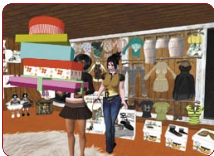
un peu de shopping virtuel

C'est un monde à part entière, accessible à tous, infini. Le soleil y brille toujours et la misère en est absente. Tout comme la laideur et le handicap, qui n'y sont plus qu'une lointaine notion. C'est le reflet des rêves de chacun, une sorte de miroir qui purge les frustrations, bien réelles, elles. Lancé il y a quatre ans, le jeu en ligne «Second Life» réunit des millions de joueurs à travers la planète. Ils ne se connaîtront sans doute jamais, mais qu'importe : l'illusion finit par l'emporter. Bienvenue dans Second Life, l'utopie virtuelle.