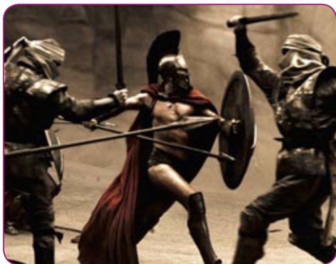
Léonidas mène le combat

Zach Snyder adapte le roman graphique de Franck Miller sur la guerre des Thermopyles et signe la plus grosse claque cinématographique de ce début d'année.