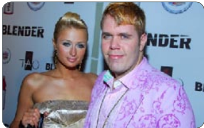
Perez Hilton en compagnie de sa nouvelle amie Paris Hilton

C es blogs s'appellent « dlisted », « perez hilton », « pink in the new blog » ou « TMZ » et ont tous un point commun : ils « blablatent » sur la vie des stars. Les infos croustillantes et journalistiques qu'ils génèrent sont devenues en quelques années une mine d'or pour leurs créateurs. Avec en moyenne 3 millions de visiteurs par jour, ils attirent un public plus large que des grands hebdomadaires américains spécialisés comme « Weekly » ou « People ».