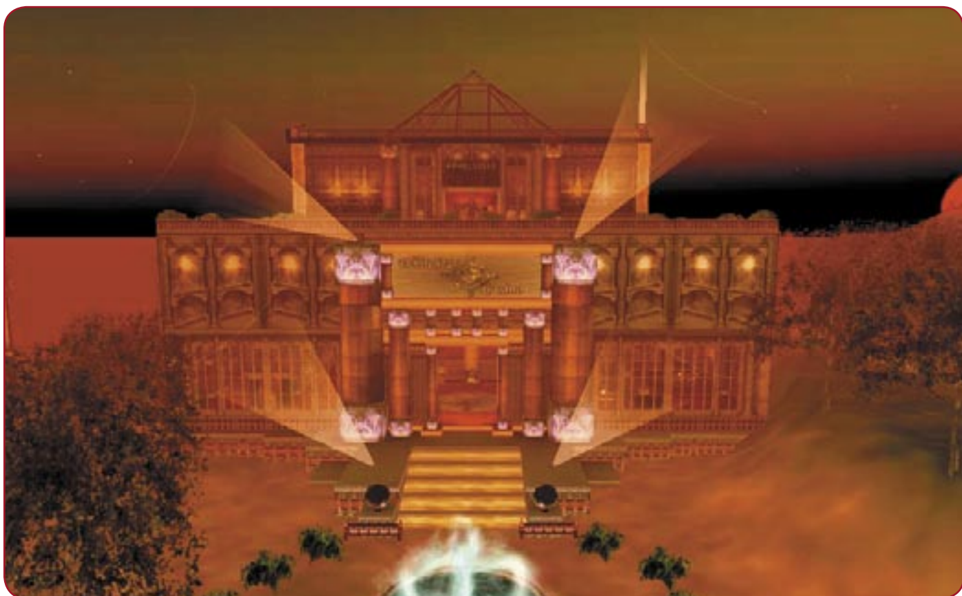
Un casino « select » de Second Life

En cliquant sur une des boules colorées jonchant le sol, on peut accomplir plusieurs types d'actions. Je teste. Bon, dans ce genre d'endroit, autant passer les détails de ce qu'il est possible de faire. C'est tout juste incroyable, presque inquiétant même : des personnes prennent plaisir à vivre par procuration, à travers un personnage qu'ils se sont créés. Et qui, finalement, n'est rien d'autre qu'une accumulation de pixels sur un écran d'ordinateur. Sortir de là, vite, c'est trop pathétique.