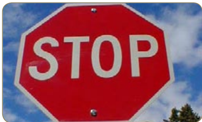
Stop aux conducteurs à problème

L e week-end dernier, un conducteur âgé de 86 ans a pris l'auto-route à contresens, provoquant plusieurs accidents. Juste avant, le même automobiliste octogénaire avait déjà causé quatre accrochages. Ce nouveau drame de la route suffit à relancer la question récurrente de la conduite des seniors. A Nice, les avis sont très partagés entre ceux qui optent pour une suppression radicale du permis B passé un certain âge et les partisans d'une visite médicale régulière pour personnes âgées.