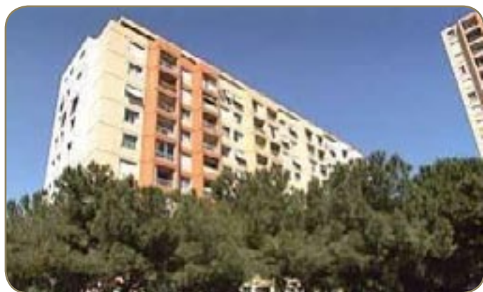
Le quartier des Moulins à Nice

Plus beau, plus dynamique, plus accessible. Lundi, Jacques Peyrat dévoilait les futures rénovations qui seront apportées au quartier des Moulins à Nice. Plus qu'un simple lifting, c'est un tout nouveau visage que la ville de Nice a décidé d'offrir à cet endroit si souvent décrié. Les habitants l'attendaient, les élus en rêvaient, les Moulins vont enfin sentir le vent tourner.