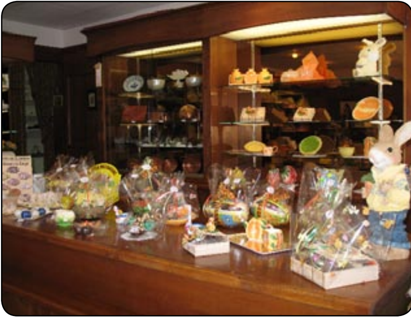
Les dernières gourmandises de Pâques. Avis aux amateurs...

Le week-end pascal a permis aux chocolatiers de réaliser une part non négligeable de leur chiffre d'affaire annuel. Une période faste véritablement indispensable en ces temps de conjoncture économique morose.