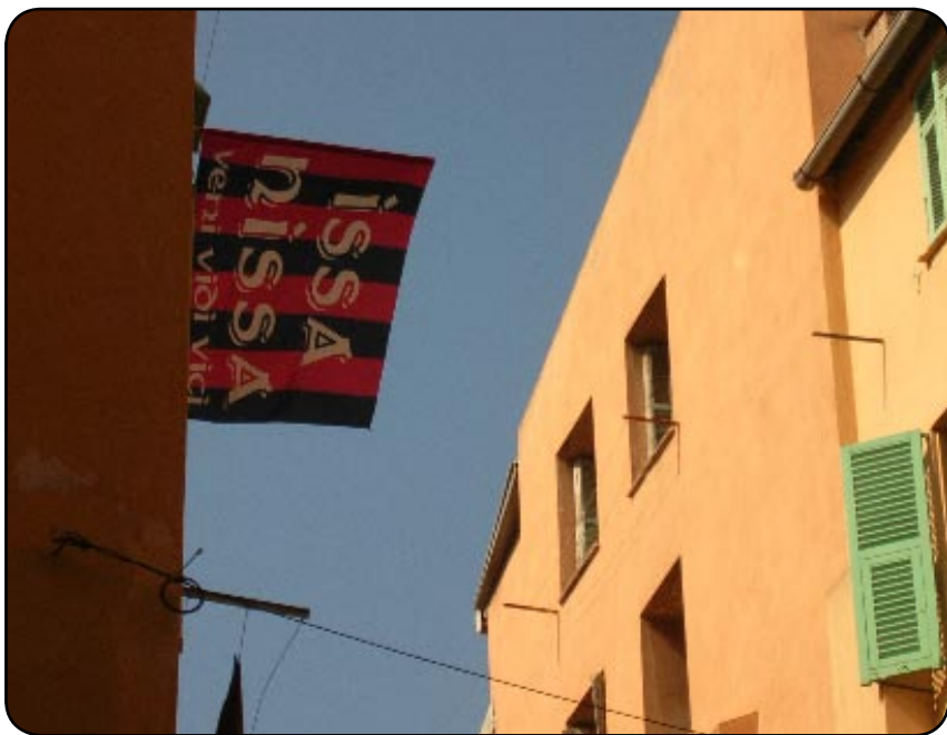
Les Niçois affichent leur soutien

La finale de la Coupe de la Ligue approche. Samedi prochain, Nice et Nancy s'affronteront au Stade de France. A cette occasion, tout est fait dans le Vieux Nice pour supporter les Aiglons.