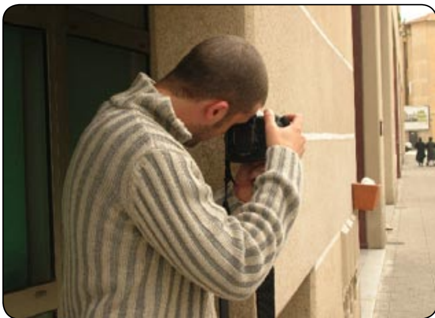
Chasseur patient, le détective privé piège ses proies en toute discrétion

Exit les enquêtes mystérieuses de Sherlock Holmes, les détectives privés modernes se nourrissent essentiellement d'histoires d'adultères ou de concurrence commerciale. Rien de très glorieux. Pourtant, les méthodes rappellent certains polars.