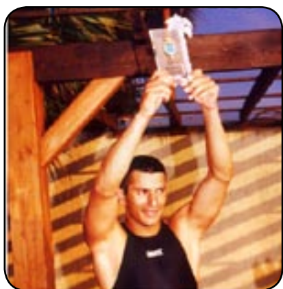
Un champion très discret.