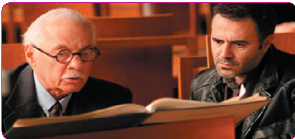
Michel Serrault et José Garcia, plongés dans l'énigme de « Pars vite et reviens tard »

Un roman à succès. Un réalisateur talentueux. Des acteurs brillants. « Pars vite et reviens tard » réunit tous les ingrédients d'un polar ambitieux. Et pourtant le spectateur reste un peu sur sa faim. Autopsie d'un film qui aurait pu faire mieux.