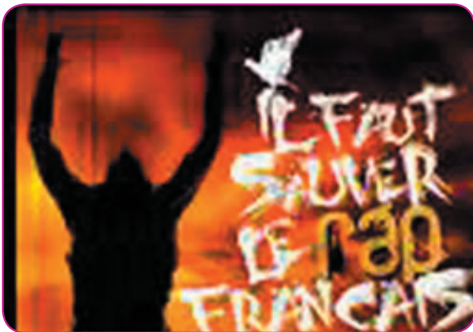
Une culture en perdition

Une nouvelle vague du rap est née : l'ultra-commercial. Le tout récent succès de Kamini, le rappeur de la campagne, agace les connaisseurs. Ceux qui suivent depuis le début, l'évolution de cette musique à message, se plaignent de ces nouveautés à but lucratif.