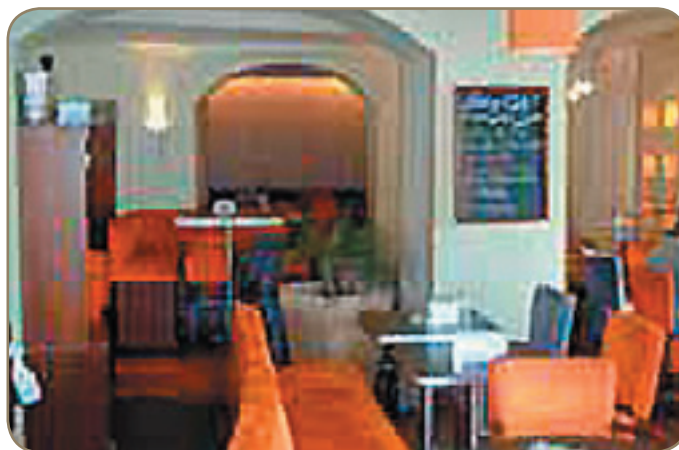
Le Bay Café, proche de la place Masséna, un décor lounge qui cache un accueil bien désagréable

« Non elle est toujours comme ça quand elle travaille. Si ça ne