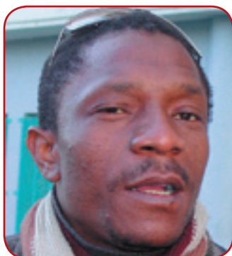
le « papy » des Moulins

Papy se réjouit d'endosser le rôle de médiateur. Il le considère comme un devoir civique. Un devoir qu'il s'efforce d'accomplir malgré des réticences. « Nous les grands, on se prend des claques », lance-t-