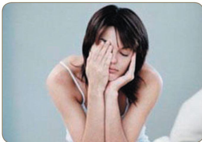
Une élève de Xavier Bertrand ?

Si tu fumes, tu seras puni, si tu conduis trop vite, idem. Bon, ça c'est fait. Maintenant, on va t'apprendre à bien dormir, car ça aussi tu as oublié comment on faisait. Ne t'inquiètes pas, comme quand tu étais petit, en maternelle, tu pourras bientôt faire la sieste au bureau. Papa Xavier Bertrand, Ministre de la santé, va prendre soin de toi.