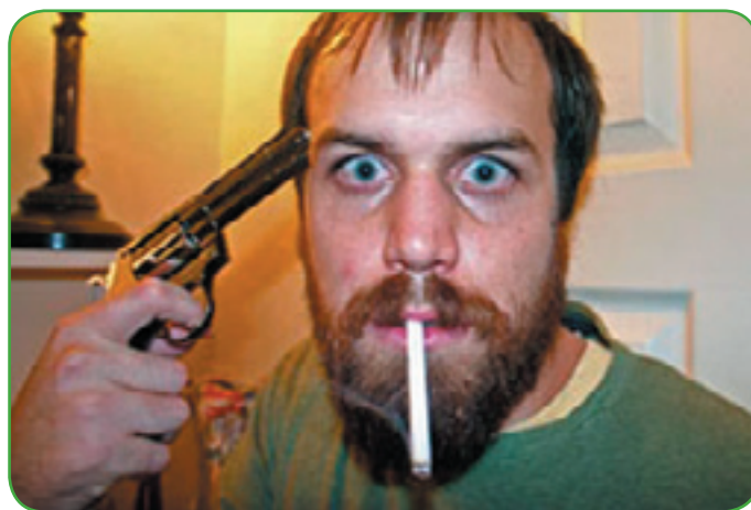
Un décret à se tirer une balle