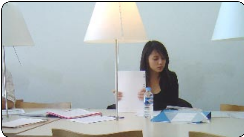
Quel avenir pour les jeunes ?

Aujourd'hui, mardi, c'est le premier jour de mobilisation nationale contre le contrat première embauche, véritable «tour de chauffe» avant les manifestations du 7 février. Dans plusieurs villes des centaines d'étudiants s'organisent, font des pétitions, manifestent. Sauf à Nice semble-t-il.