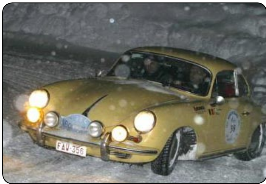
Des voitures de collection pour une course endiablée

Rouler beaucoup, de jour comme de nuit, être toujours aux aguets, prêt à parer le moindre souci mécanique ou s'arrêter en bord de route pour monter les chaînes, endurer le froid et les cols enneigés, mais avec dans la tête la douce image du rocher monégasque. C'était autrefois l'ambiance du Rallye Automobile de Monte-Carlo. C'est aujourd'hui celle du Rallye Monte-Carlo Historique.