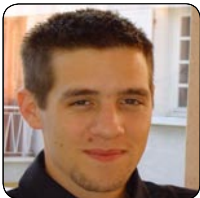
Le sourire de la réussite

Au total, 618 000 jeunes sont sans emploi, soit 22,8% des actifs. Alors pour conjurer le mauvais sort, les moins de 25 ans sont de plus en plus nombreux à tenter leur chance, seuls. Ils créent leur propre entreprise. Portrait d'un jeune créateur.