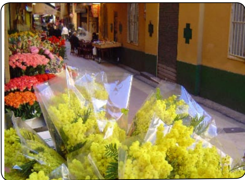
Dans les rues du vieux Nice, quelques brins fleurissent

Il n'a pas encore fleuri et ça se voit. Le mimosa se fait attendre dans les Aples-Maritimes au grand dam des mimosistes azuréens. La fleur de l'hiver est en retard cette année, la faute à la météo.