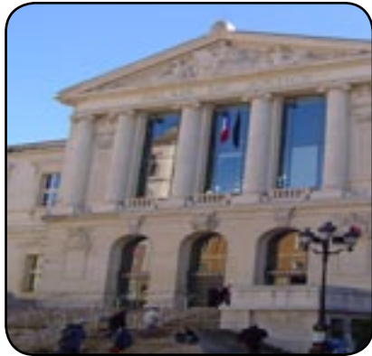
La justice montrée du doigt

L'erreur judiciaire, ou l'horreur judiciaire comme ont pu le vivre les acquittés d'Outreau... Nombres d'affaires criminelles ont laissé leur empreinte dans l'histoire. Nombre d'innocents se sont vus condamnés à tort. Dans certains cas, le doute plane encore. Dans d'autres, le doute a fait place à une certitude: la justice n'a pas su découvrir la vérité.