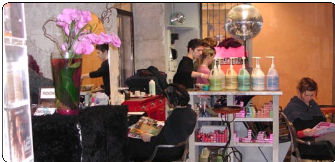
Ici les cheveux sont rock'n roll