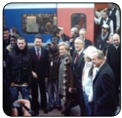
Le TGV des Pièces Jaunes en gare de Nice

Le train des pièces jaunes était à Nice le 29 janvier. Entourée d'artistes et du judoka David Douillet, Bernadette Chirac faisait figure de grand mère Rock'n'Roll. Des paillettes pour sortir les gens de chez eux dans le mauvais temps, et récolter le maximum d'argent au profit des enfants malades.