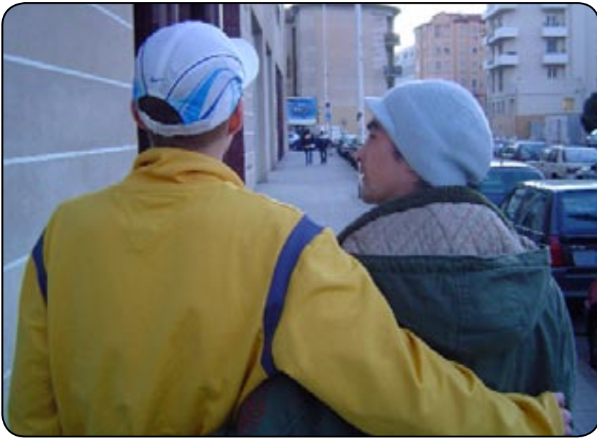
En route pour être papa(s)

Papa, bébé et... papa. Hors de question dans le droit français. Pour preuve de ce refus de légiférer, 184 députés de droite ont signé la semaine dernière un « manifeste pour la défense du droit fondamental de l'enfant d'être accueilli et de pouvoir s'épanouir dans une famille composée d'un père et d'une mère.