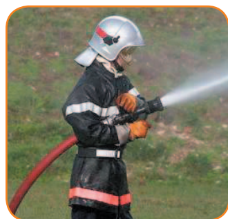
Le fantasme de l'uniforme

c'est un fait. Mais un cordonnier n'est pas moins serviable. Ni moins utile. De ses mains d'orfèvre, il ne cesse de confectionner de sublimes souliers à la gente féminine. Jamais le petit écran ne vante le savoir-faire d'un charcutier, la sérénité d'un bibliothécaire ou la malice d'un employé de bureau. L'audimat se montre généralement bien plus dopé par l'apparition d'un guerrier, quand bien même il se montre parfaitement inactif.