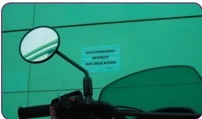
À Saint Jean d'Angély, même le stationnement des deux roues relève de l'épreuve de force.

Les étudiants du pôle universitaire Saint-Jean d'Angély pourront bientôt bénéficier d'un parking entièrement rénové. Mais dans la vie, on n'a jamais rien sans rien : l'accès au parking ne pourra se faire que moyennant finance !