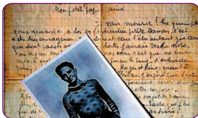
Guy Môquet, qui se souviendrait de lui sans la polémique actuelle ?