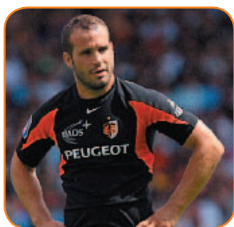
Frédéric Michalak, bellâtre de ces dames

Les femmes rêvent d'eux. Eux hantent tous leurs fantasmes. Leur force : ils sont pompiers, militaires voire rugbymen. A Nice, aucune ne sait résister à leur uniforme. Restent les autres. Chauffeurs de bus, libraires ou cordonniers, tous se révoltent contre l'instinct sélectif de la gente féminine.