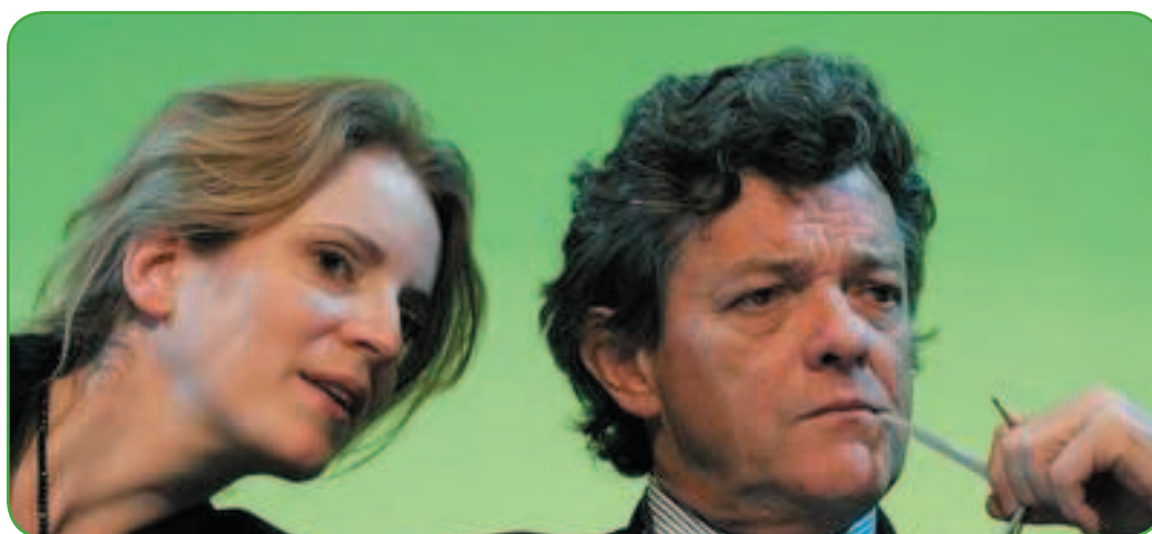
Nathalie Kosciusko-Morizet et Jean-Louis Borloo seront au cœur des débats.

Depuis ce matin, le coup d'envoi du Grenelle de l'environnement est enfin lancé. Après des mois de préparation, experts, représentants de l'Etat, et associations écologistes vont plancher durant 2 jours, sur une série de mesures labelisées vertes, en faveur de la lutte contre le réchauffement climatique.