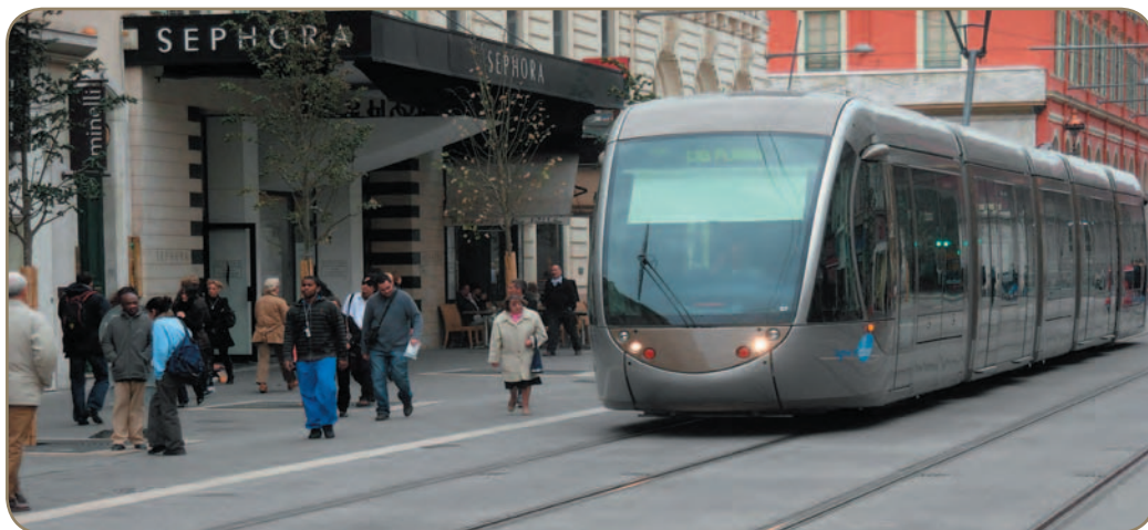
Les Niçois ont repris l'habitude de flâner sur les trottoirs.

Le tramway fait aujourd'hui partie du paysage niçois. Automobilistes et piétons ont appris à vivre avec lui et connaissent les règles de sécurité. Bien éduquée, la population est prête à l'accueillir le 24 novembre prochain, jour de l'inauguration.