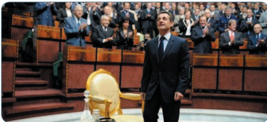
Nicolas Sarkozy présente son projet devant le Parlement marocain.

C'est aujourd'hui que Nicolas Sarkozy va défendre et promouvoir «son» union méditerranéenne. Au palais royal Marshan à Tanger, l'élite politique et économique marocaine est réunie. Présentation et réactions.