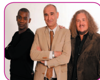
Le nouveau jury de la Star Academy

un Passi en Manu Katché et un Pascal Negre en Dove Attia. Mais qui sera le psychoromantico-erotico membre du jury qui divaguera sur les déhanchés de la directrice?