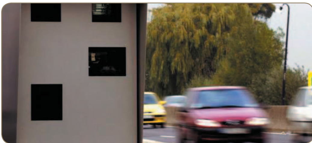
Radars : une vision faussée de la réalité.

Un rapport de police, datant de février 2006, conclut en l'inexactitude des mesures effectuées par les radars fixes et embarqués. Les 350 millions d'euros d'amendes, générés en 2006 par ces détecteurs en France, seraient donc injustifiés.